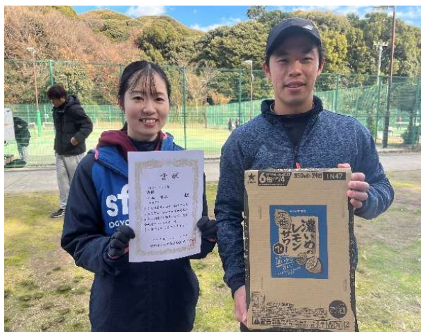
優勝: 中山・中山 (Wish TC)