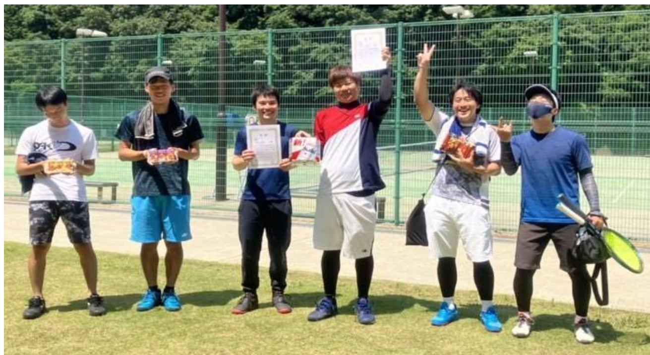
男子Aクラス入賞者