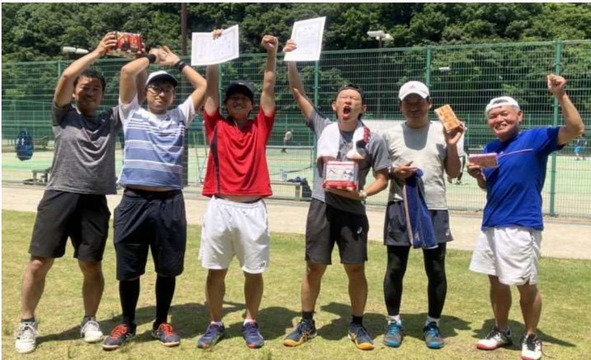
男子Bクラス入賞者