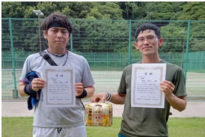
優勝: 築地・長田(グリーンヒル・竜南TC)