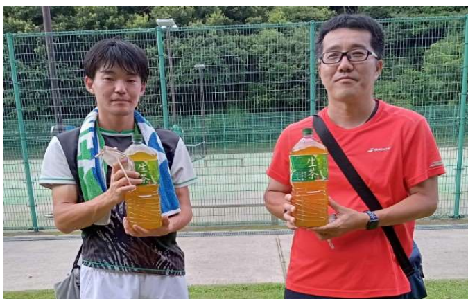
3位: 那須野・橘田(グリーンヒル・竜南TC)