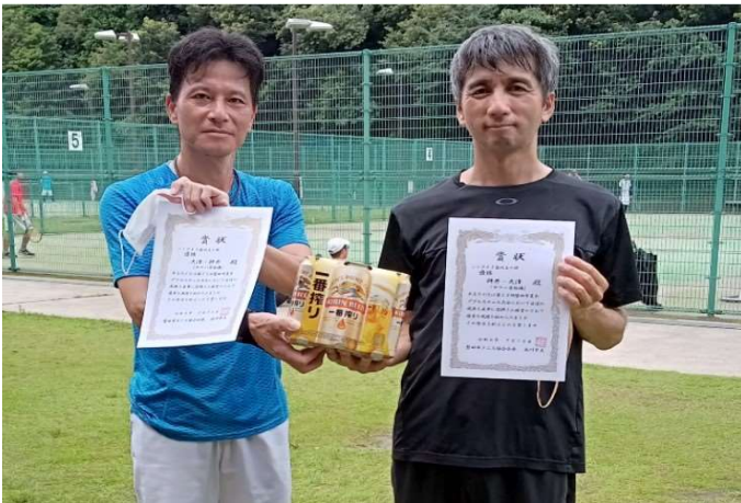
優勝:大津・柘井(ヤマハ発動機)