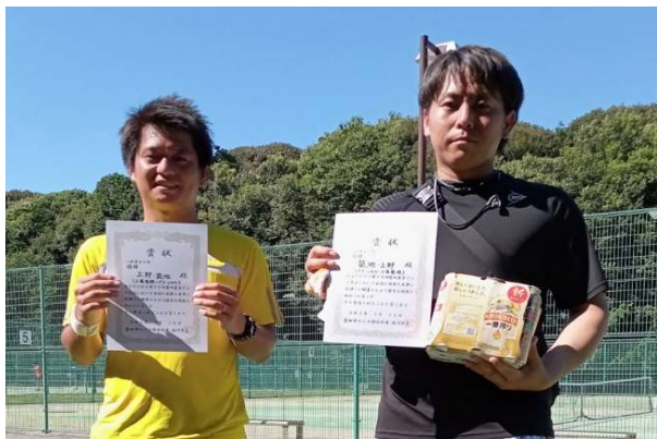
優勝: 上野・築・(三菱電機・グリーンヒル)